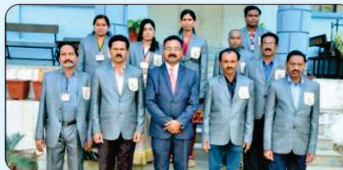
Non Teaching Staff