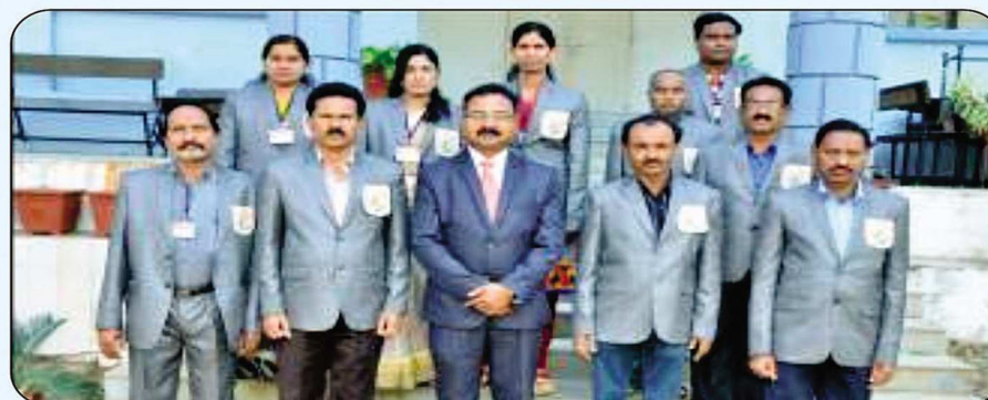
Non Teaching Staff