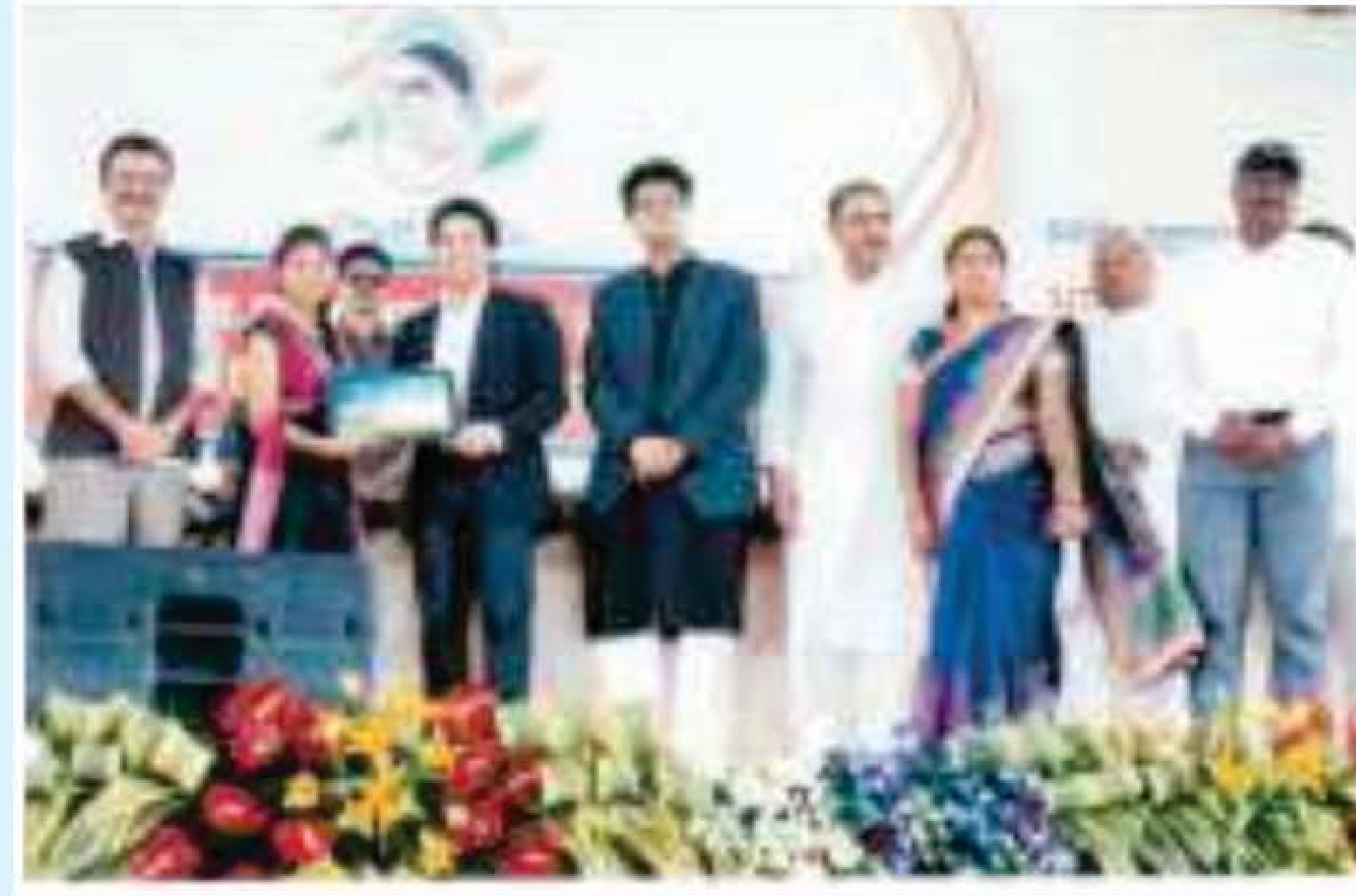
Hon'ble Shri Sachin Tendulkar Presenting Gold Medal