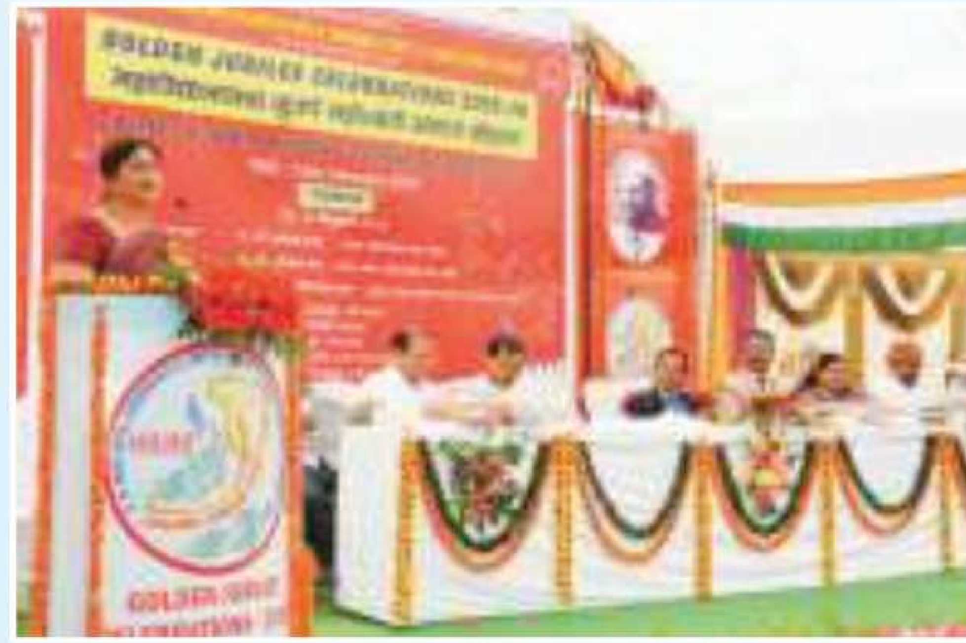
Hon'ble Smt. Varsha Patel address to the students