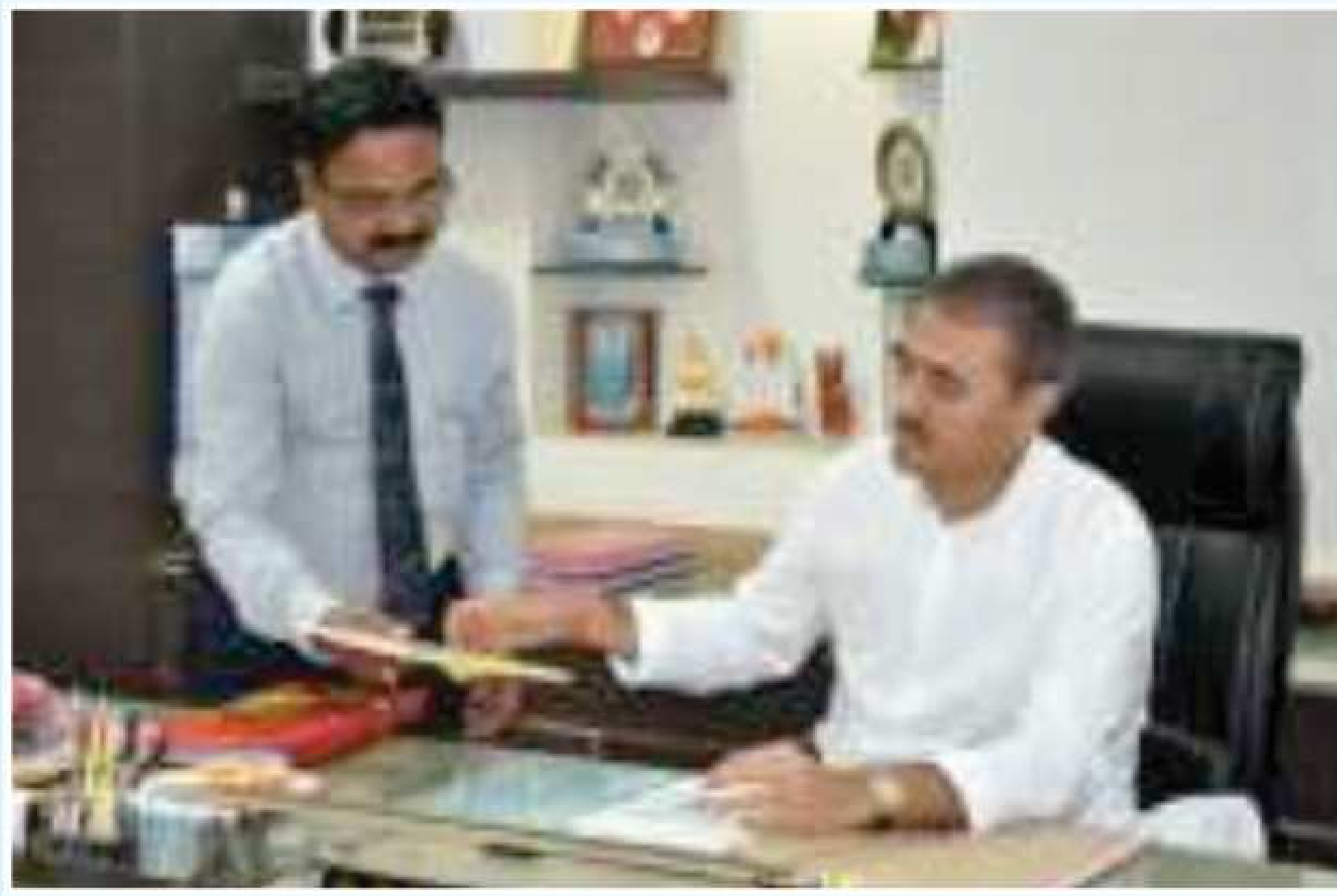
Hon'ble Shri Praful Patel Visit