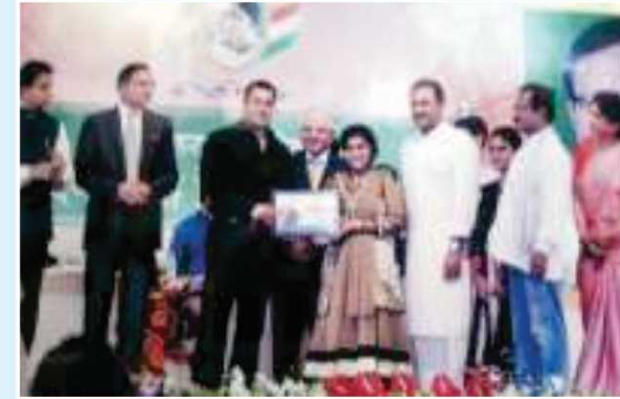
Hon'ble Cine Actor Salman Khan Presenting Gold Medal