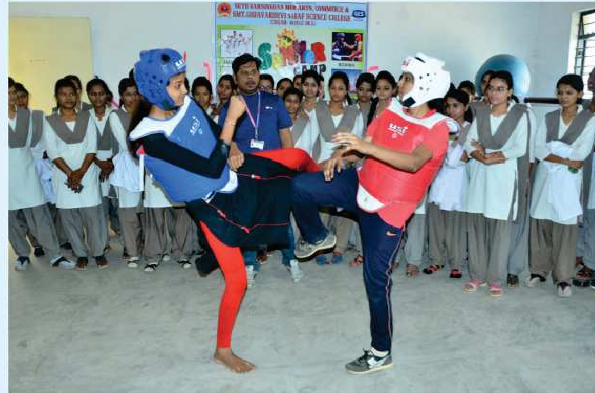
University Level Competition