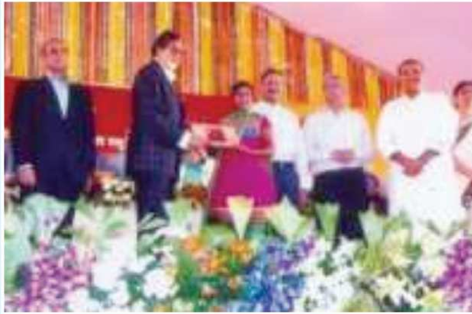
Hon'ble Shri Amitabh Bacchan Presenting Gold Medal