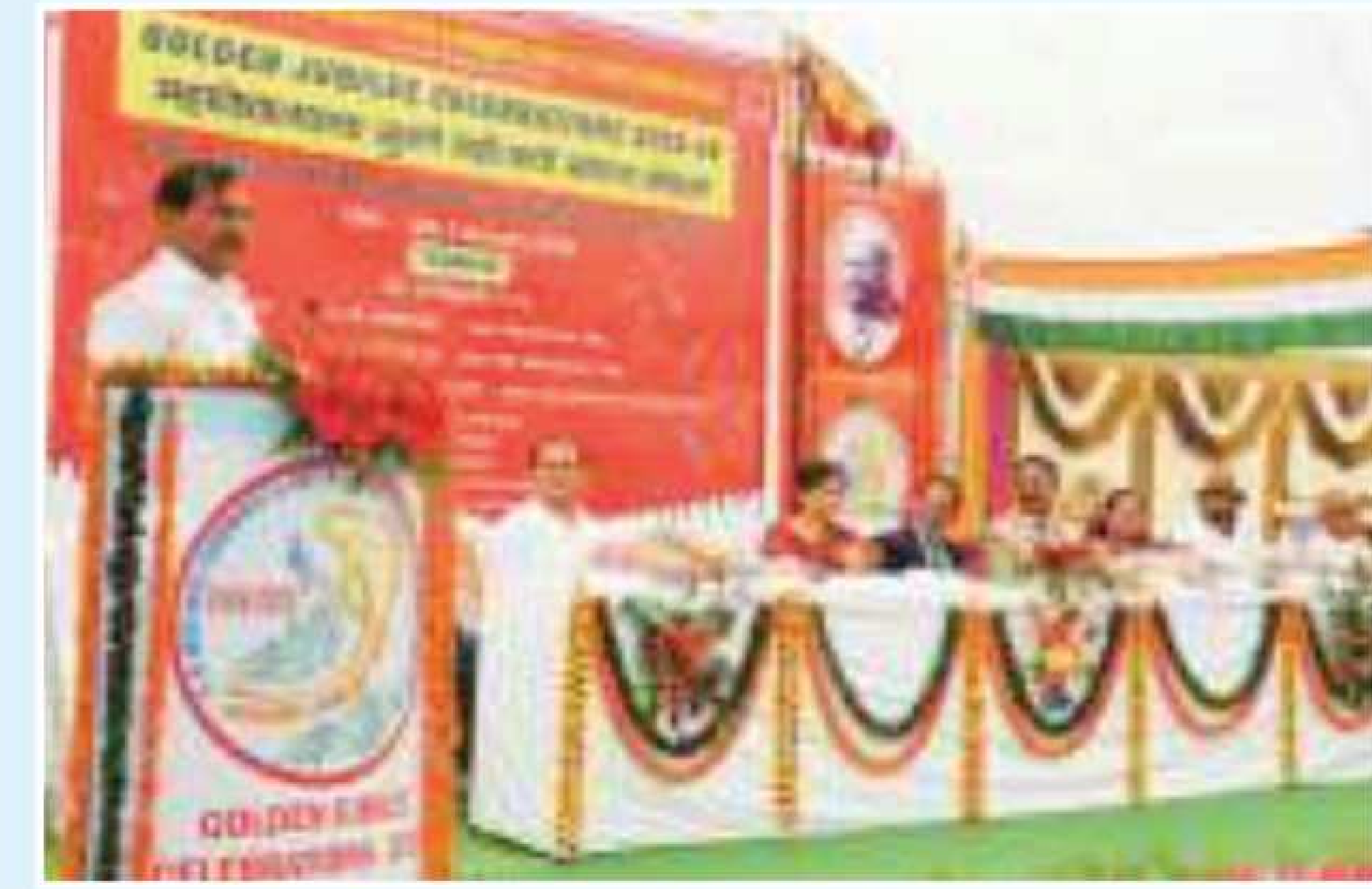
Hon'ble Shri Rajendraji Jain address to the students