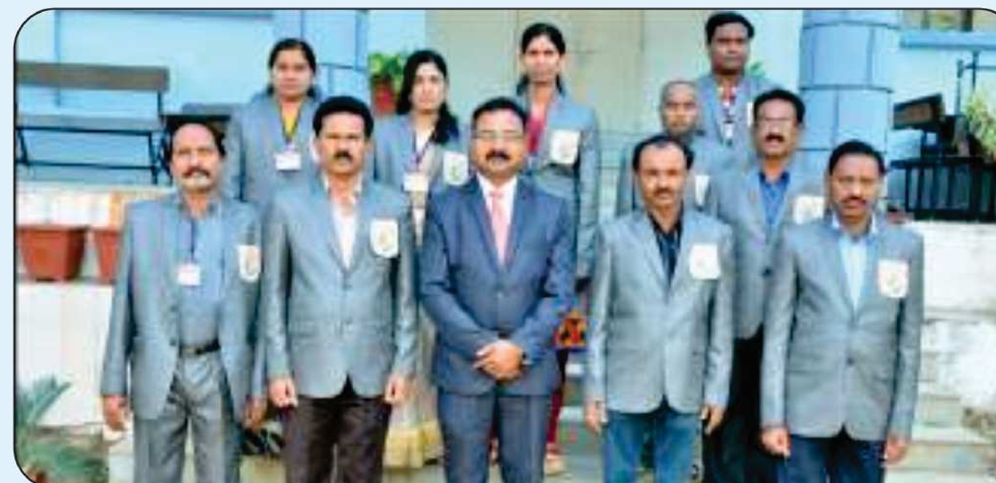
Non Teaching Staff