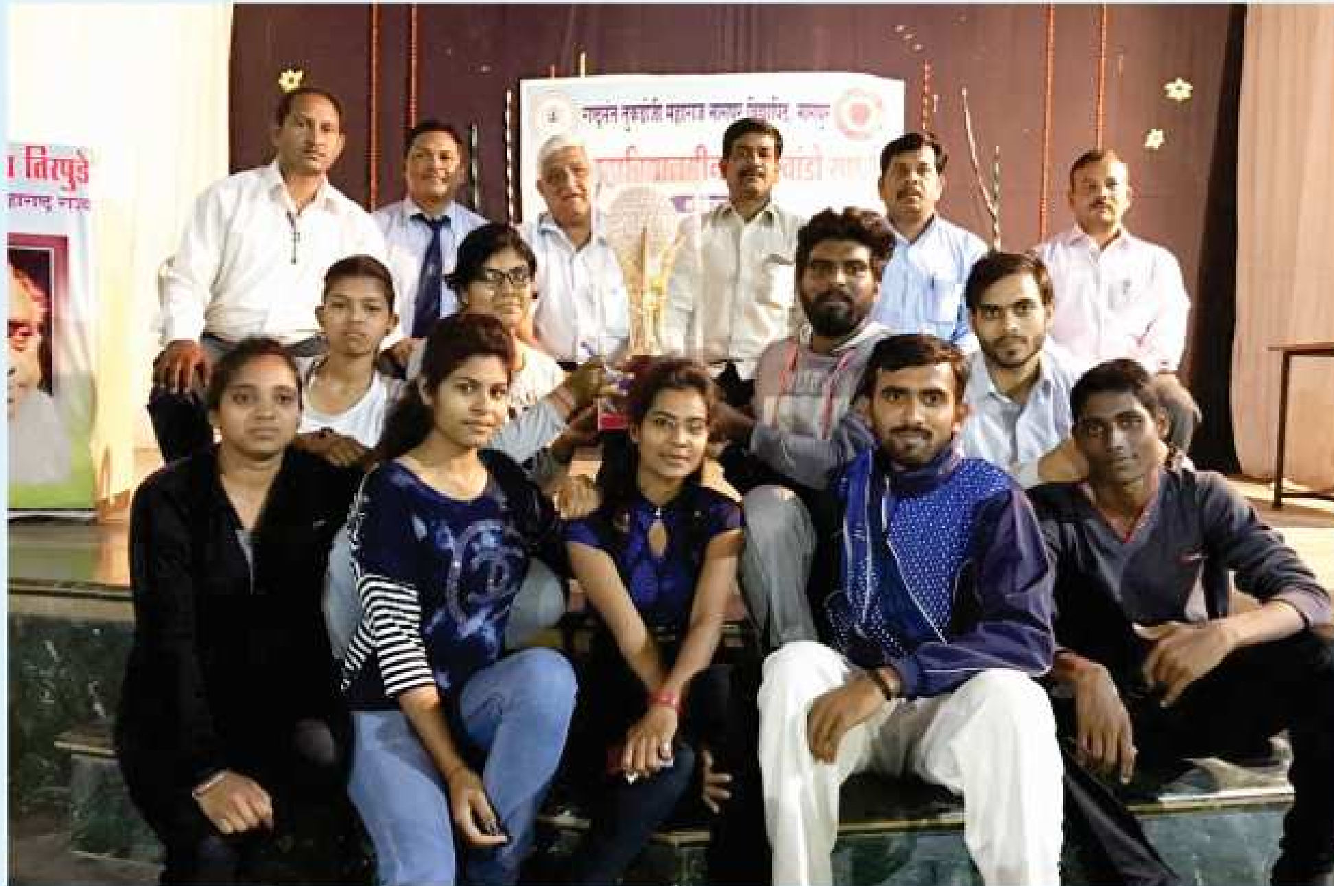
RTM Nagpur University champion in Taikowndo of Men and women section 12;