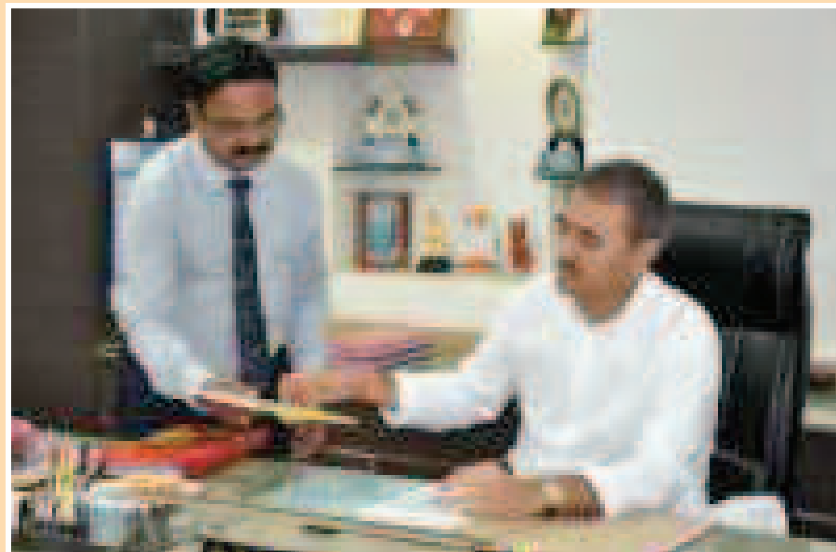
Hon'ble Shri Praful Patel Visit