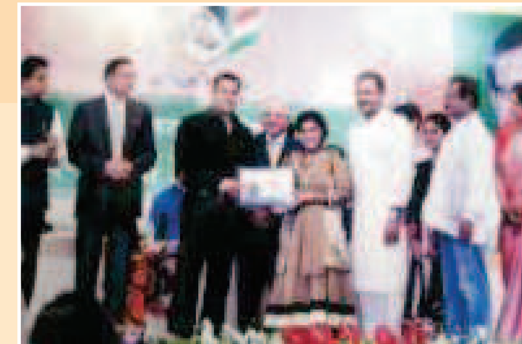
Hon'ble Cine Actor Salman Khan Presenting Gold Medal