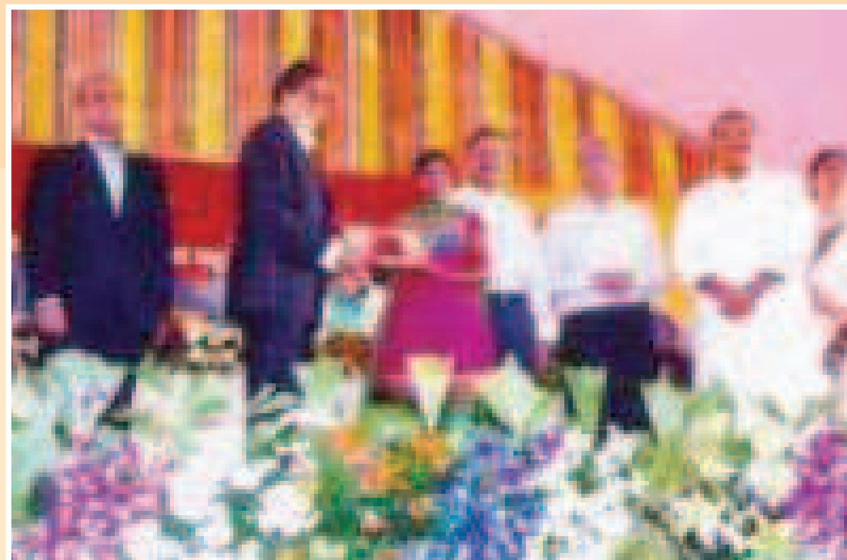
Hon'ble Shri Amitabh Bacchan Presenting Gold Medal