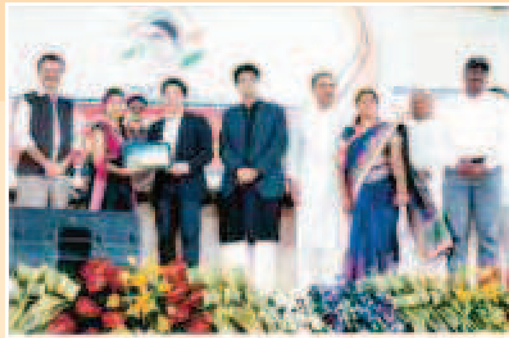
Hon'ble Shri Sachin Tendulkar Presenting Gold Medal