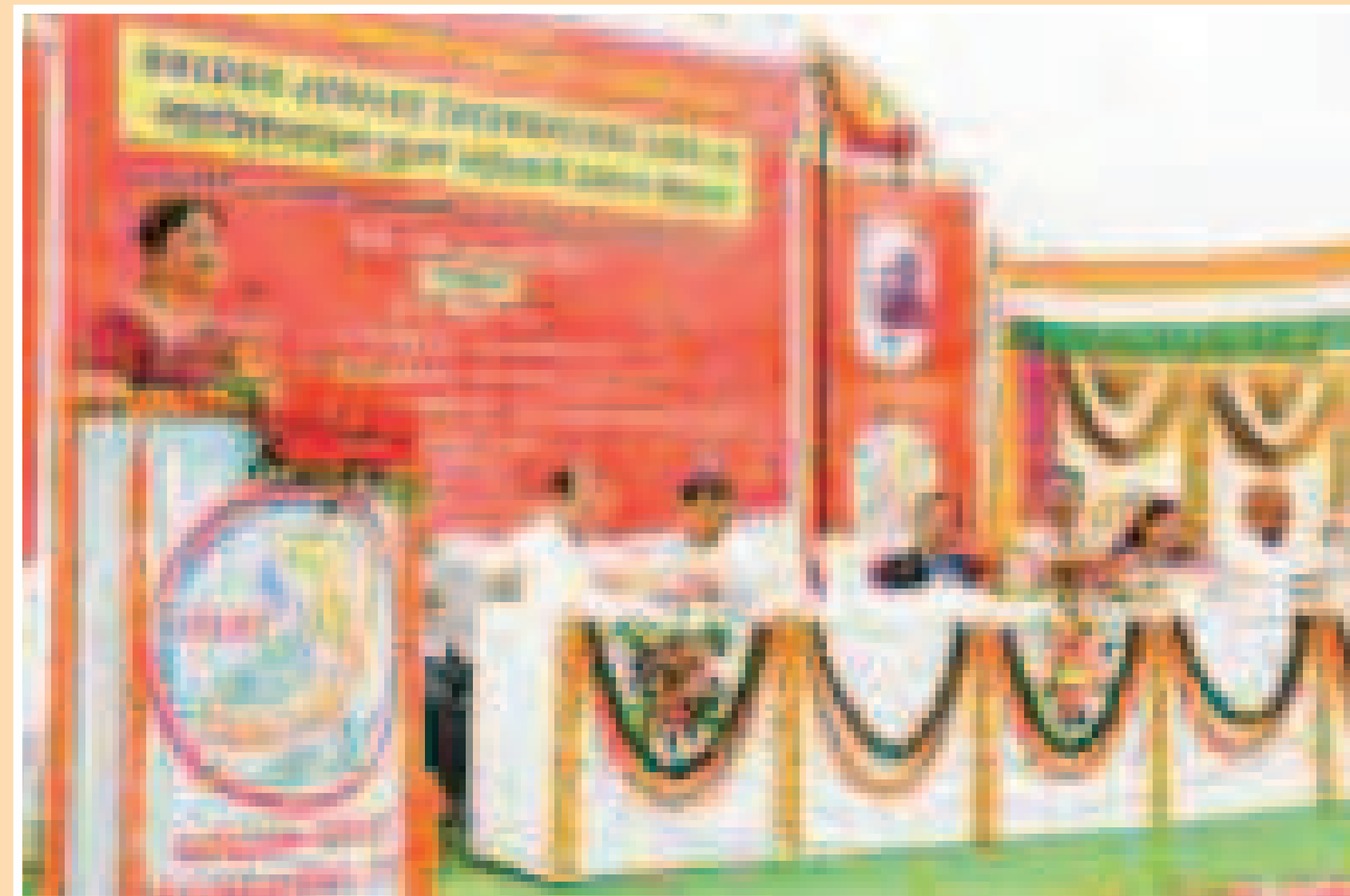
Hon'ble Smt. Varsha Patel address to the students