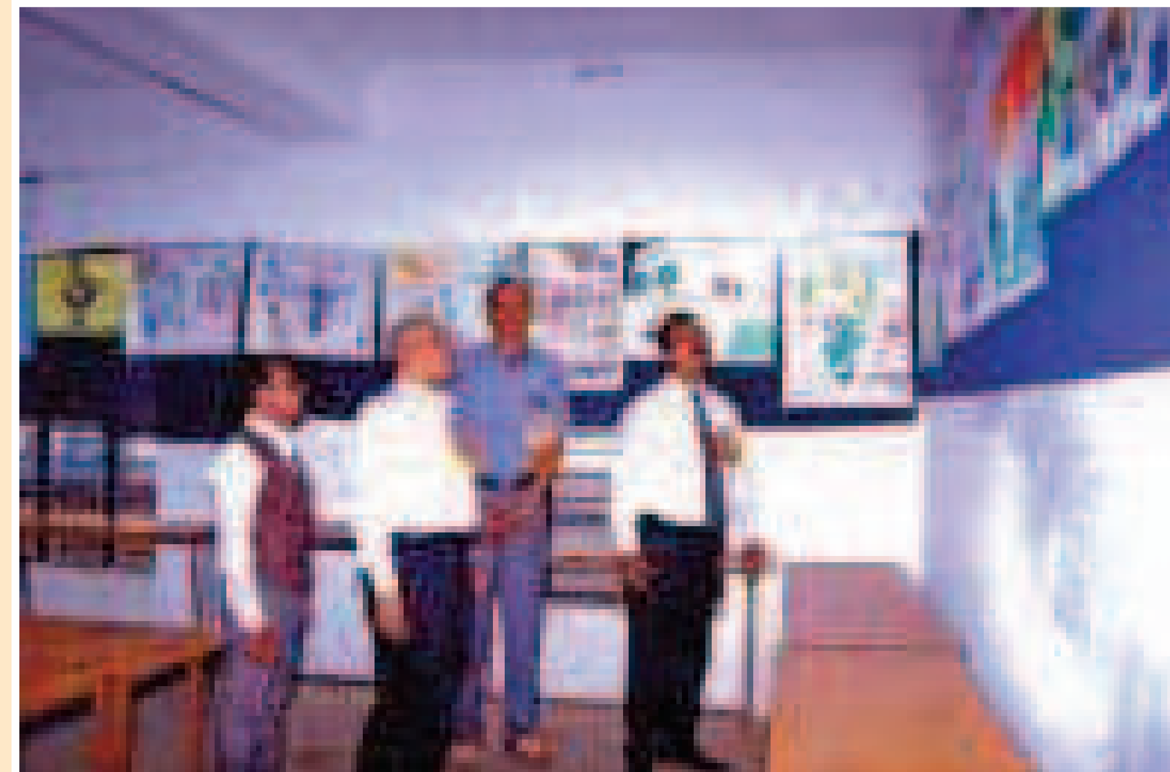
Science Poster Exhibition