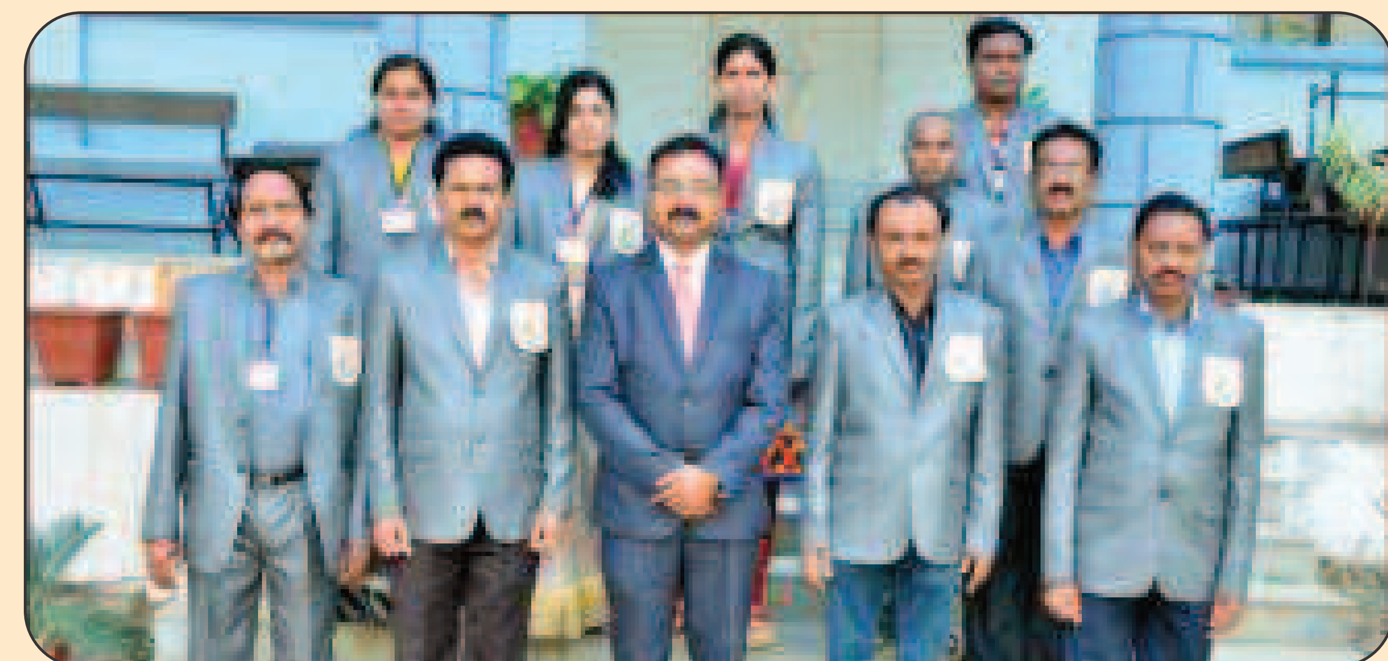
Non Teaching Staff