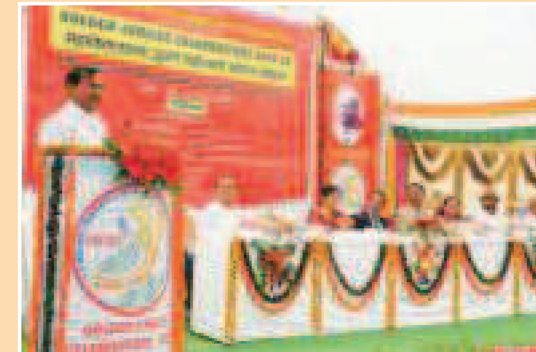
Hon'ble Shri Rajendraji Jain address to the students